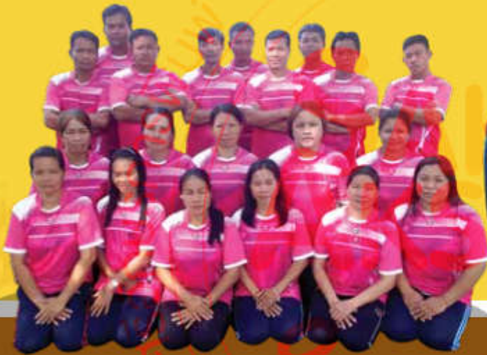
พนักงานรักษาความสะอาด